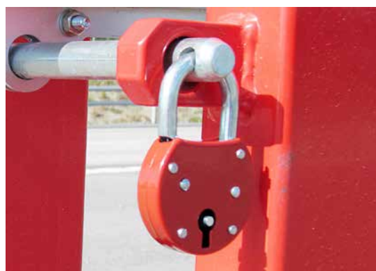
Hanglås , nyckellås eller brandkårslås

Bommen vrider sig på tätade och underhållsfria lager.